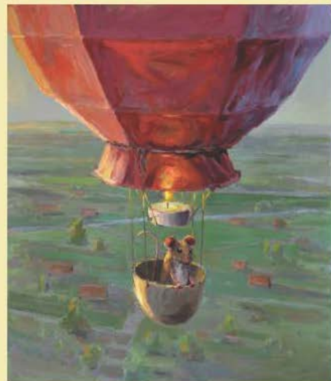
EDWIN GRISSEN, SCHILDERIJEN